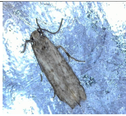
Πυρηνοτρήτης ( Prays oleae )