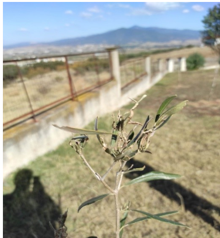
Μαργαρόνια σε νεαρά δενδρύλλια