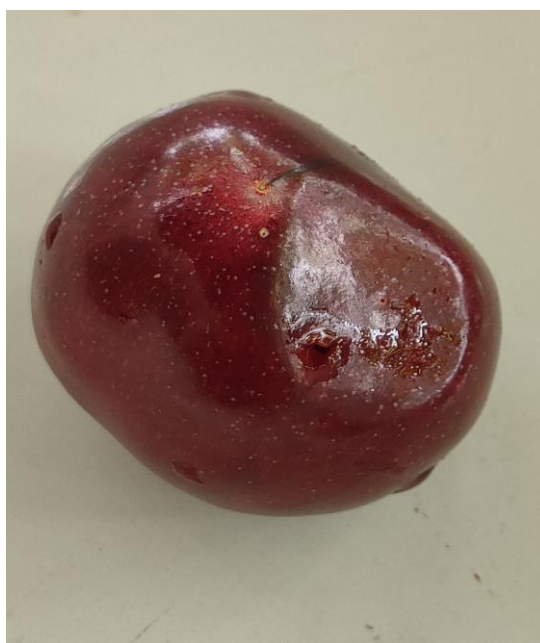
Προσβολή και προνύμφη ραγολέτιδας σε κεράσι.