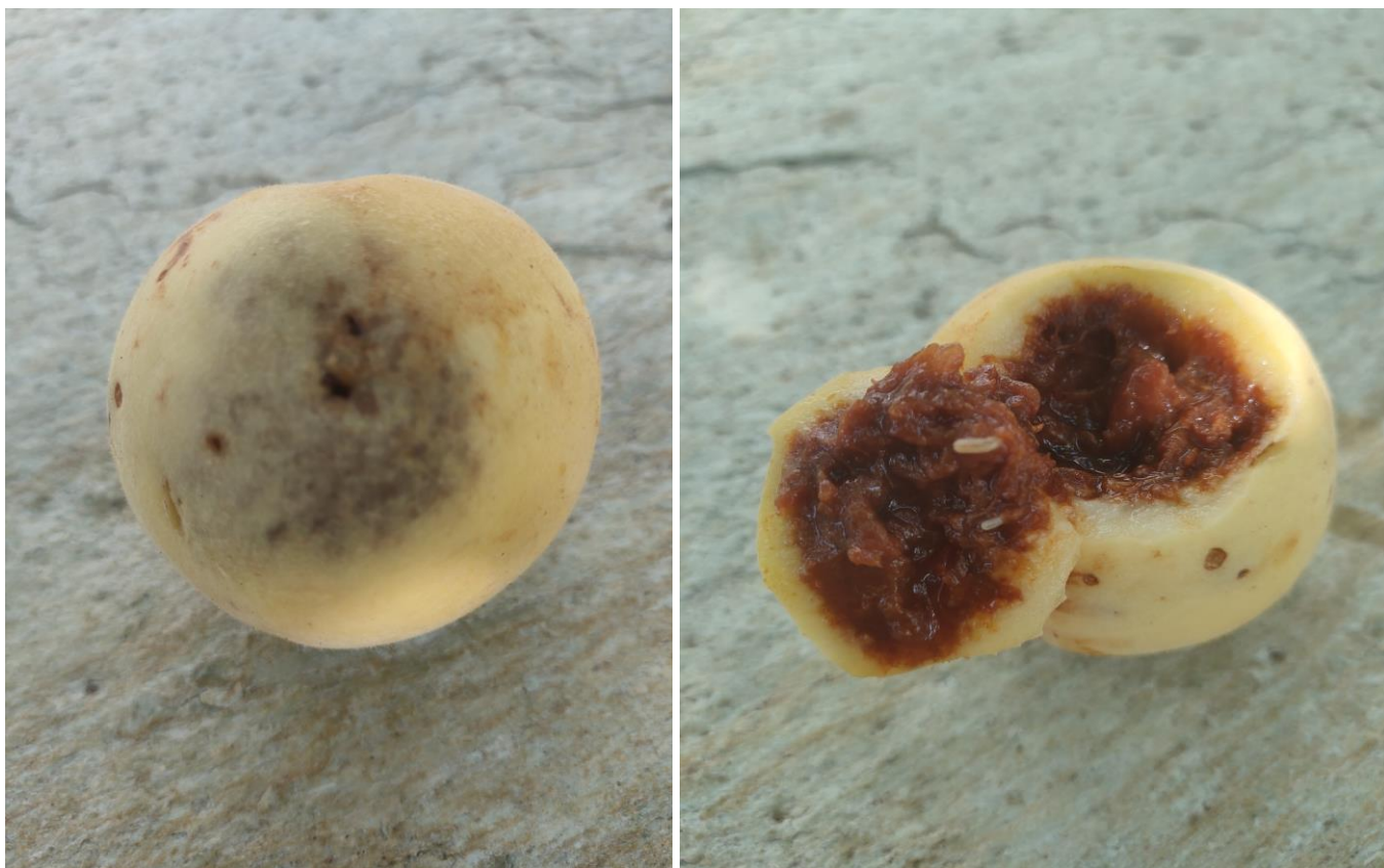
Προσβολή και προνύμφες μύγας μεσογείου σε ροδάκινο

Τρόπος εφαρμογής δολωματικών ψεκασμών: Στο ψεκαστικό διάλυμα προστίθεται ελκυστική ουσία (υδρολυμένη πρωτεΐνη) σε αναλογία 2%. Ψεκάζεται με ποσότητα περίπου 200ml (ποτήρι κρασιού) το εσωτερικό και κορυφαίο τμήμα της κόμης (φύλλωμα και όχι καρποί) κάθε δευτέρου ή τρίτου δένδρου του οπωρώνα. Τα δένδρα της περιμέτρου του οπωρώνα σε μία ή δύο σειρές ψεκάζονται όλα. Είναι σημαντικό να ψεκάζονται ο φράχτης και οι θάμνοι στην περίμετρο του οπωρώνα.