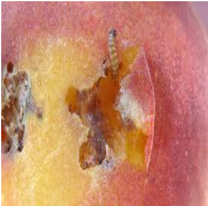
Προσβολή ανάρσιας σε ροδάκινο