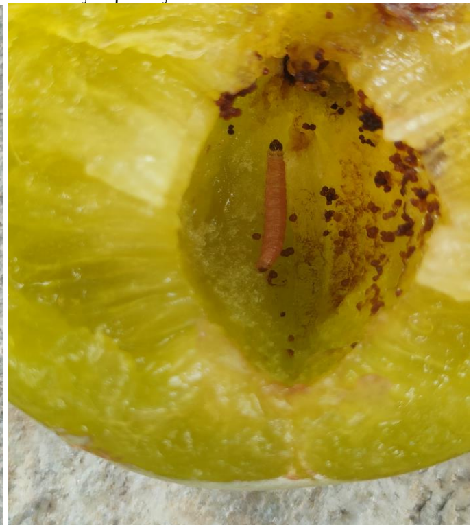
Προσβολή και προνύμφη καρπόκαψας της δαμασκηνιάς.