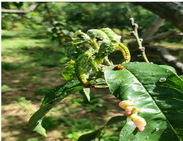
Προσβολή αφίδων σε τρυφερό βλαστό ροδακινιάς.

Σε οπωρώνες που παρατηρείται προσβολή της νεαρής βλάστησης από αφίδες, συνιστάται επέμβαση με ένα κατάλληλο και εγκεκριμένο για την καλλιέργεια εντομοκτόνο.