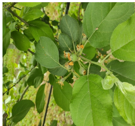
Η πλήρης πτώση πετάλων

Συνιστάται εβδομαδιαία δειγματοληψία 5 φύλλων/ δέντρο, από 20 σημασμένα δέντρα. Εάν καταμετρηθούν περισσότερα από 20 ακάρεα/φύλλο να γίνει επέμβαση μετά την πτώση των πετάλων με εγκεκριμένα ακαρεοκτόνα σκευάσματα.