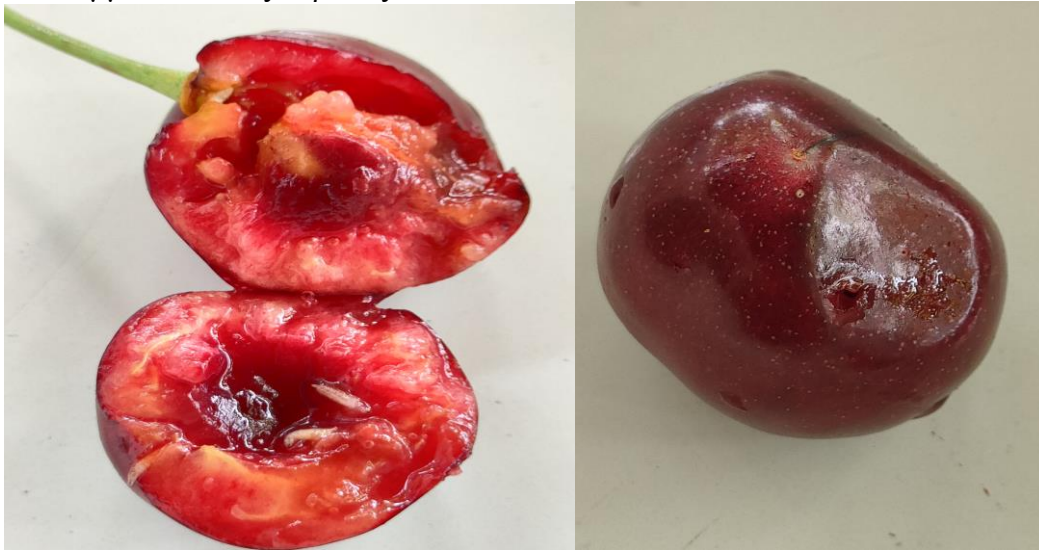
κερασιού από προνύμφη ραγολέτιδας. Φωτ Θ. Μόσχος

Επειδή ο χρόνος μεταξύ έναρξης προσβολής και συγκομιδής είναι μικρός, να δοθεί μεγάλη προσοχή στην επιλογή των εντομοκτόνων, ώστε να μην υπάρξει κίνδυνος υπολειμμάτων στους καρπούς.