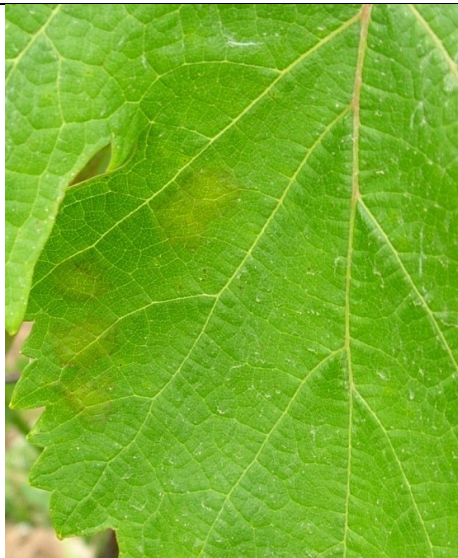
Κηλίδες λαδιού στην πάνω επιφάνεια του φύλλου

Η επέμβαση κρίνεται απαραίτητη εάν διαπιστωθεί η πρώτη ένδειξη συμπτωμάτων, δηλαδή κηλίδες λαδιού ή επάνθιση. Η επέμβαση να πραγματοποιηθεί όταν το επιτρέψουν οι καιρικές συνθήκες.