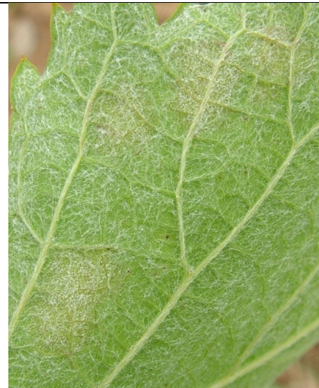
Επάνθιση (καρποφορία του μύκητα) στην κάτω επιφάνεια του φύλλου